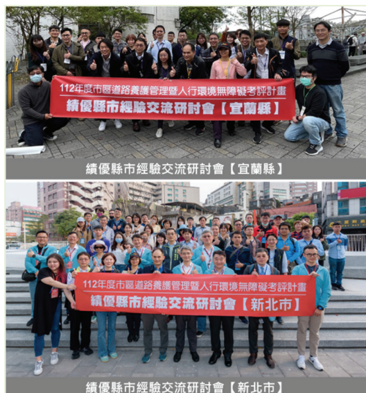
圖4 縣市交流研討會活動花絮

本學會受內政部國土管理署委託辦理市區道路人行無障礙考評計畫至今已15年，協助中央主管機關針對市區道路養護及人行環境無障礙現況進行考評。為促進各縣(市)之間市區道路養護及人行環境無障礙相關業務推動之經驗分享與相互學習機會，於112年3月舉辦宜蘭縣與新北市兩場之「績優縣市經驗交流研討會」，邀請表現優異的縣(市)就相關主題進行演講，並安排縣市政府經驗交