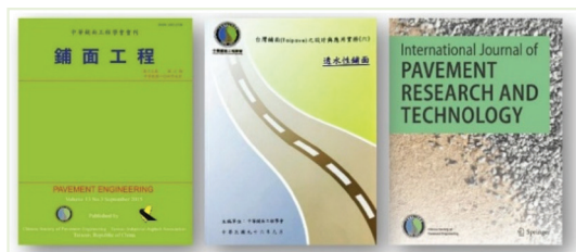
圖3 鋪面學會發行刊物

學術交流之風氣。九十六年出版台灣鋪面（Taipave）之設計與應用實務系列叢書。為提昇學會在國際上之競爭力，並與全世界接軌，於民國九十七年發行EI索引之國際期刊「International Journal of Pavement Research and Technology (IJPRT)」迄今，每年出版成長幅度相當顯著與穩定，IJPRT已申請SCI索引刻正審查中，持續獲得科技部「全國性學術團體辦理學術推廣業務計畫」補助，顯見其已成為國際名鋪面專業期刊，其專業度及學術水準亦已受到國際鋪面社群肯定，鋪面學會發行刊物如圖3所示。