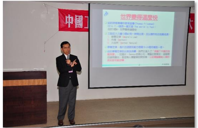
大會特邀演講：生產力 4.0 與全面品質管理