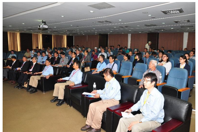
會員大會會場盛況