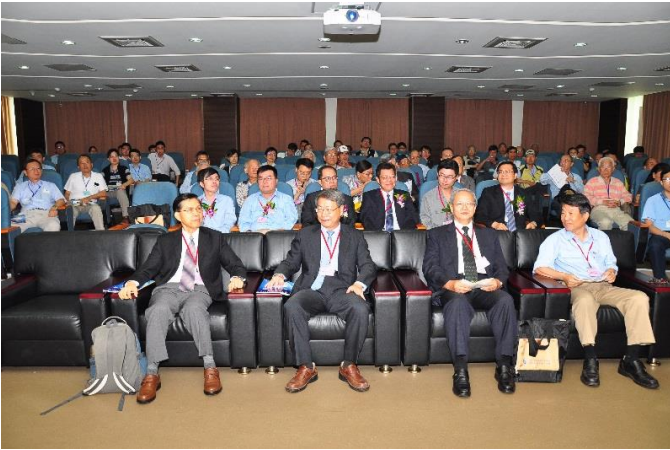
本會陳理事長(第一排中)、總會楊秘書長(第一排右二)、特邀演講陳榮譽顧問(第一排左)、孟籌備主委(第一排右)和與會來賓合影