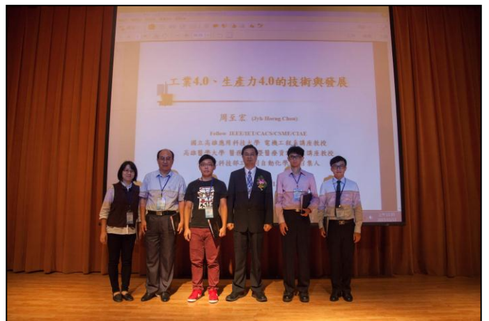
大會林主席與最佳論文得獎者合影留念