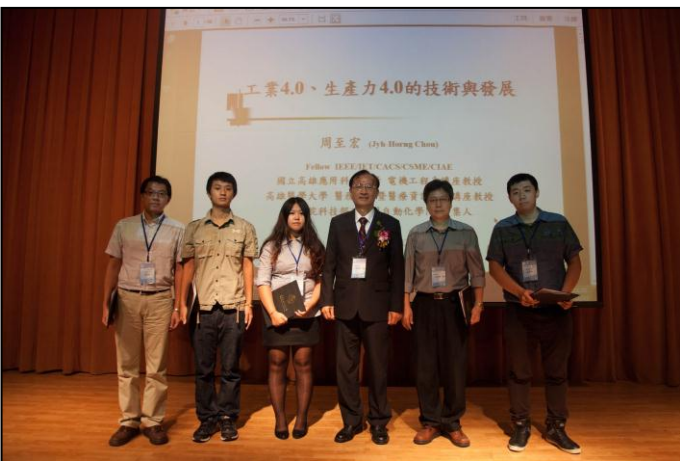
趙校長與最佳論文得獎者合影留念