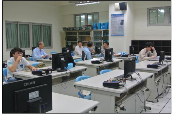
中龍同仁認真參與研討