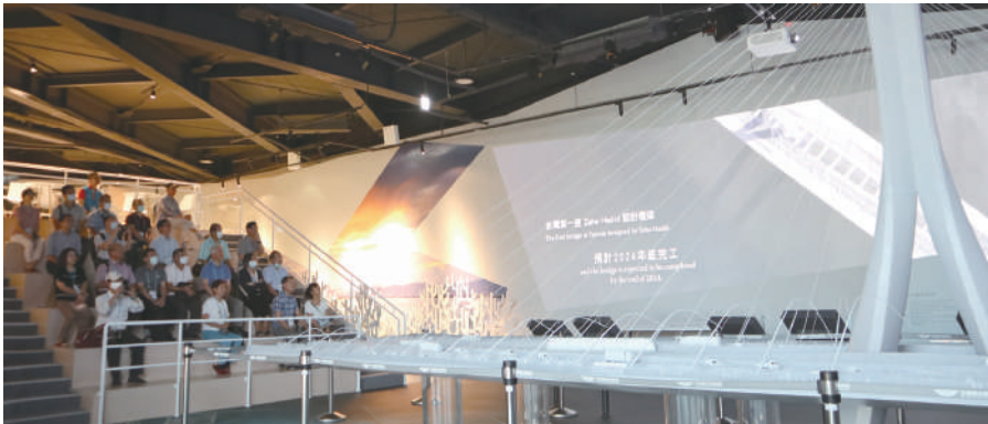
▲ 觀看淡江大橋影片與模型