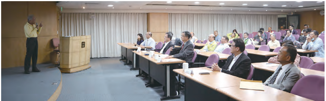
▲ 工程人員海外工作經驗分享座談