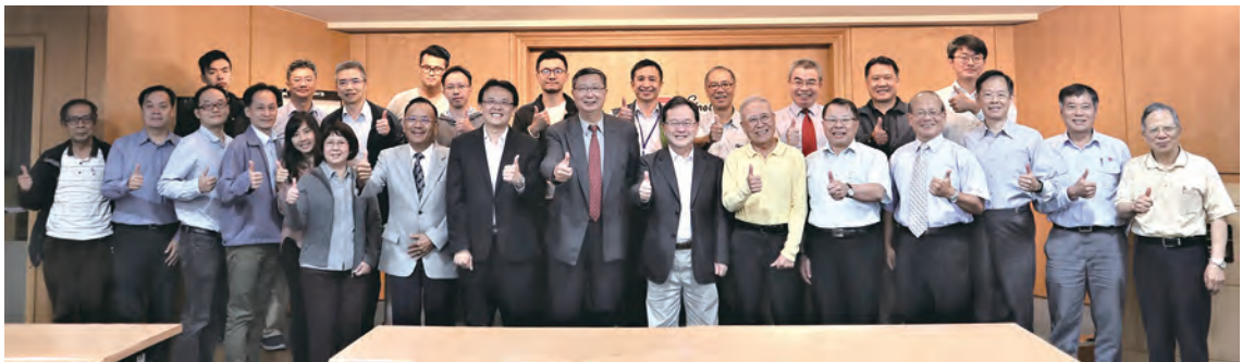
▲ 全體出席貴賓合影