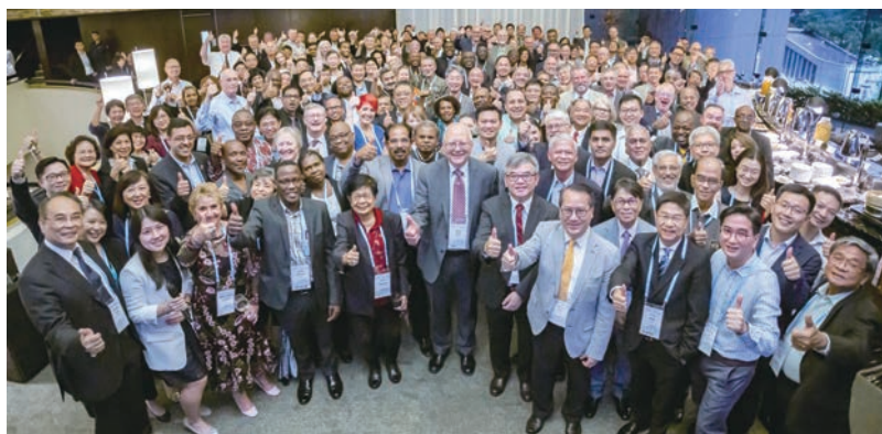
▲ 全體會員國代表合影