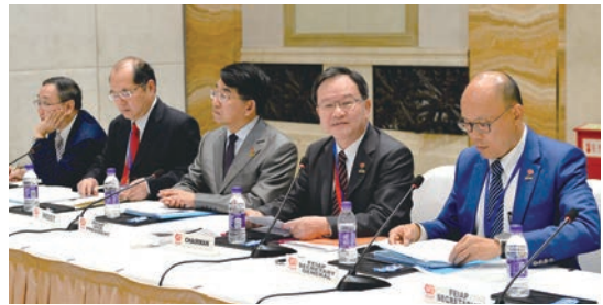
▲ FEIAP第27屆會員大會6月30日在西安舉行