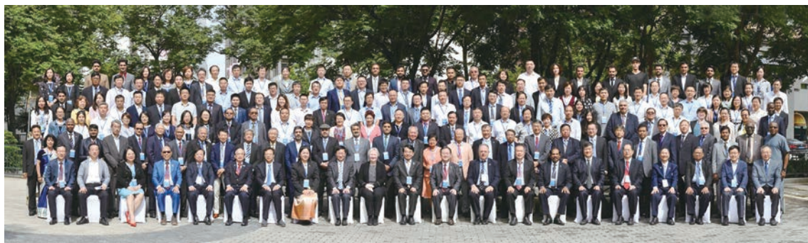
▲ 全體出席經濟體代表合影

作小組的工作架構、可能合作夥伴、招募工作小組成員等議題。本次會議只有我國、日本、菲律賓、中國大陸、新加坡及馬來西亞等經濟體代表出席，未來希望可邀請香港、緬甸、巴基斯坦等共同參與。會中並討論希望各經濟體以舉辦各類國際型活動，來創造青年工程師互相學習、互動的機會。