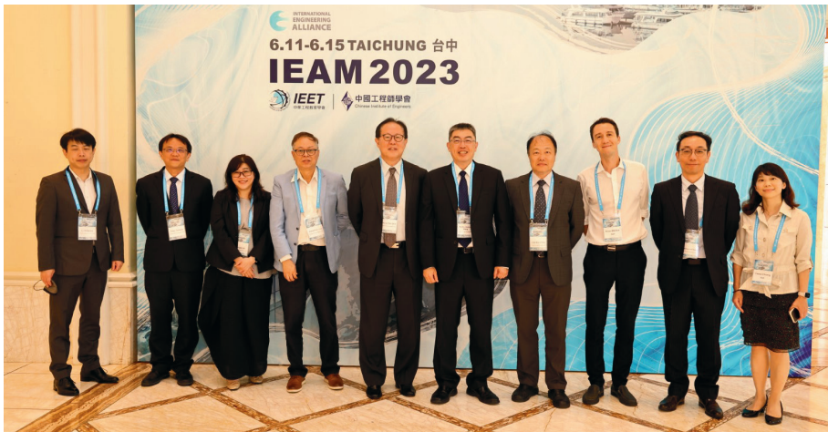
▲ 本學會亞太工程師監委會同仁與工程會代表合影