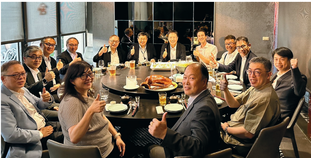
▲ 本學會楊理事長宴請日方貴賓