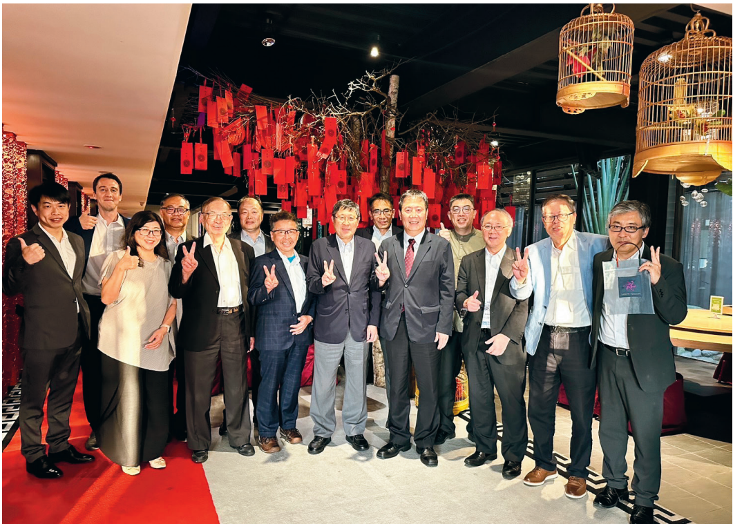
▲ 全體出席貴賓合影留念