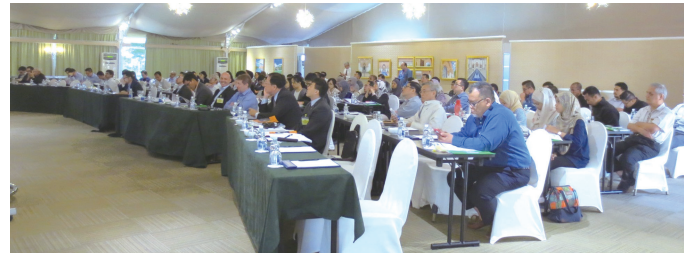
▲三地大地工程研討會開會場景

本項研討會自 2009 年起由本學會與香港 HKIE、馬來西亞 IEM 輪流主辦，旨在增進大地工程實務經驗之國際交流。本屆會議主題為 Geotechnical Challenges in Infrastructure and Transportation Projects，共發表 11 篇論文，馬、港、台三地合計約 120 人出席。◆