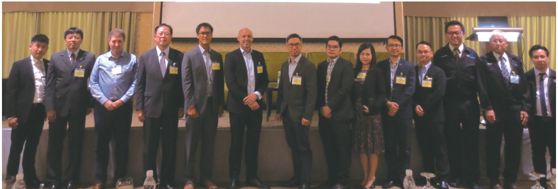
▲主持人及講師合影 -1